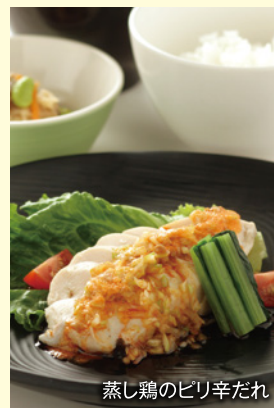
蒸し鶏のピリ辛だれ