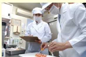
徹底した 衛生管理